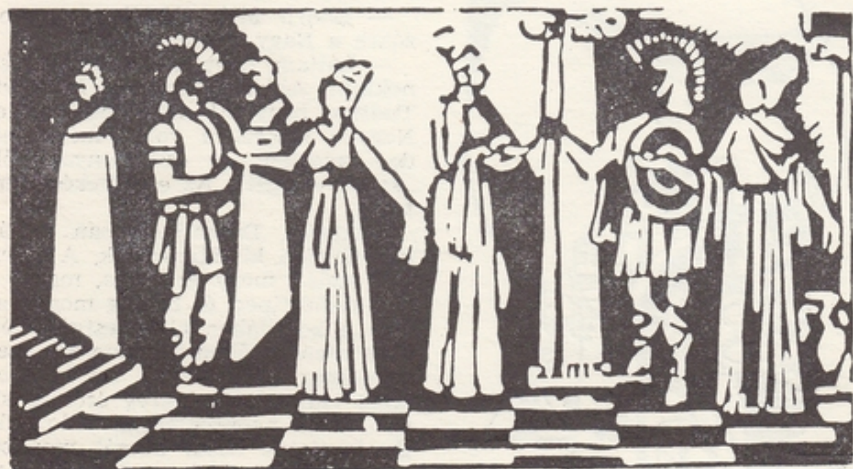
RÓMAI SZÍN (linó)